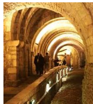
Galerie des Salines de Salins

Départ pour les Salines de Salins les Bains , un millénaire d'exploitation des sources salées. Les Salines de Salins ont été exploitées jusqu'en 1962. Aujourd'hui, l'eau salée est toujours pompée pour alimenter les thermes de la ville (rhumatisme, piscine d'eau salée avec jacuzzi, hammam et sauna).