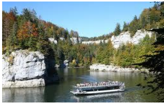
Croisière sur le Doubs