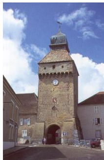
Tour de l'horloge à Nozeroy

Départ pour la visite guidée de Nozeroy , petite cité médiévale de caractère (restes de l'enceinte 13ème, porte de l'Horloge, porte de Nods, ruines du château, maisons à arcades, clocher 19ème...).