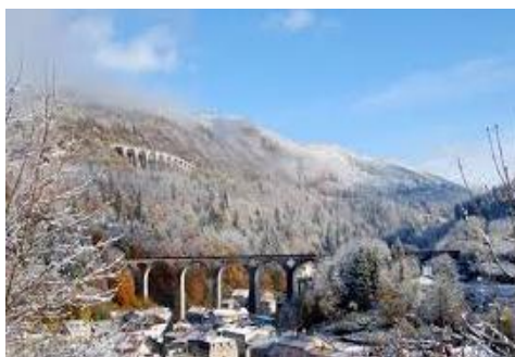
La Ligne des Hirondelles

Départ de Champagnole ou Morez, pour un voyage aller-retour en autorail sur la « ligne des Hirondelles » jusqu'à St Claude, avec un repas le midi au restaurant , la visite du musée de la pipe et du diamant ainsi que les stalles de la cathédrale de St Claude. La ligne des Hirondelles traverse le Jura de part en part, reliant Dole à St Claude. Plus de 120 km de voyage entre ciel et terre, entre plaine et montagne. 1h30 de cheminement à travers les réputés vignobles de l'Arbois, les vastes plateaux du Grandvaux, la Vallée de la Bienne.