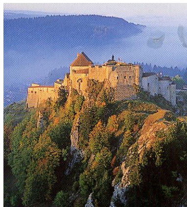
Château de Joux