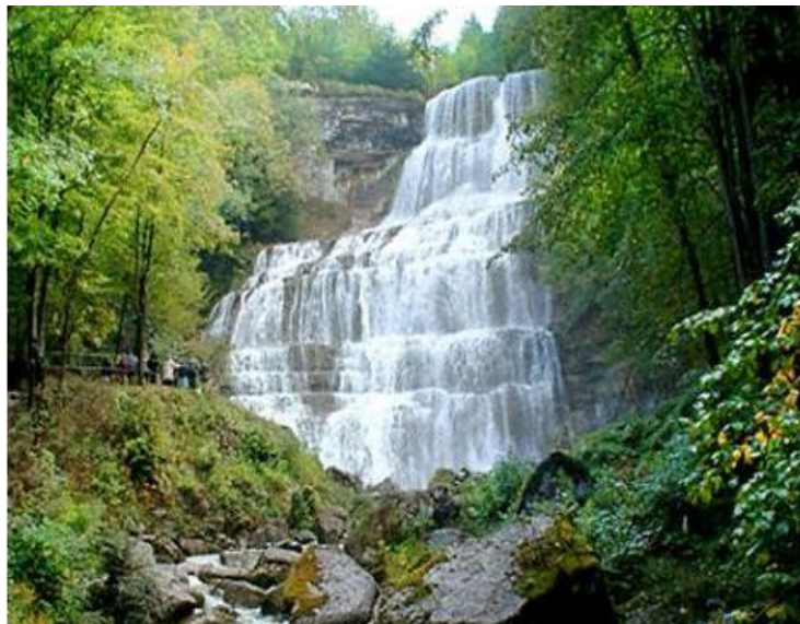
Cascades du Hérisson