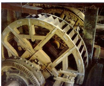
Roue hydraulique de la Taillanderie

Arrêt au retour à la Source du Lison. Pour les plus courageux, possibilité d'accéder à la source à pieds depuis la taillanderie par un petit sentier très agréable de trente minutes.