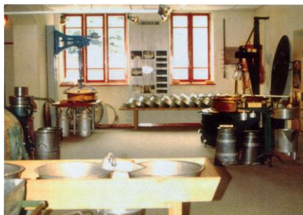
Maison du Comté

Déjeuner au restaurant « la Finette » à Arbois.