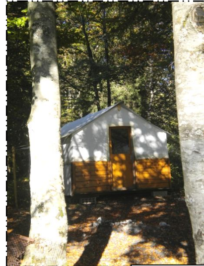
La Tente Trappeur

Vous avez choisi de découvrir les montagnes du Jura lors de vos prochaines vacances! Situé à Cerniébaud, petit village du plateau de Nozeroy au pied du Massif de la Haute-Joux, entre 1000 et 1200 mètres d'altitude, le Chalet de la Haute-Joux est au cœur d'un site idyllique pour la pratique des activités estivales et hivernales. Toute l'équipe vous accueille chaleureusement et vous invite à découvrir le Chalet de la Haute Joux et La Yourte ou la Tente Trappeur.